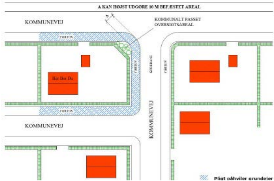
Figur 1 Hjørnegrund grænsende til 3 kommuneveje med fortov.

Illustration af regulativets principper. Illustrationerne er medtaget for at tydeliggøre nogle af principperne i lov om offentlige veje og lov om private fællesveje.