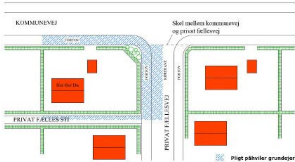
Figur 2 Hjørnegrund med adgang til kommunevej samt grænser til privat fællesvej hhv. -sti.

Grundejer kan pålægges pligten på alle sider, da de ligger i ubrudt forlængelse af en adgang til ejendommen.